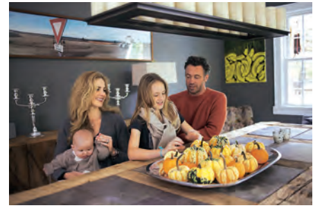
Die Gegend um Poughkeepsie ist jetzt im Indian Sommer besonders schön